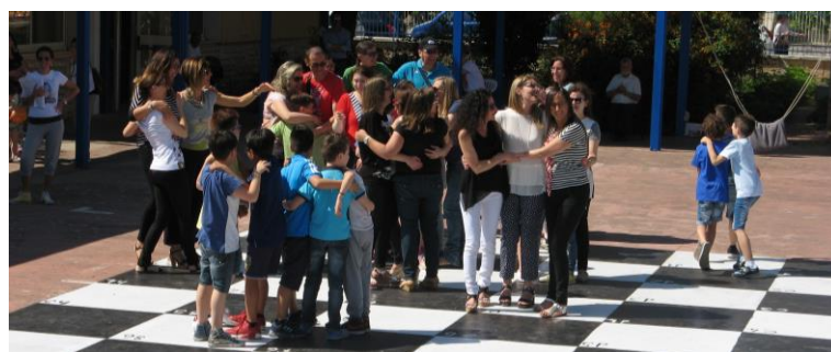
... e dei greggi...