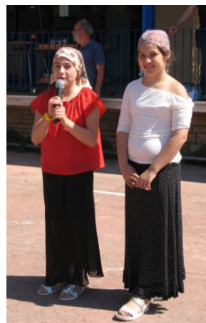
Le zingarelle e u conza siegge